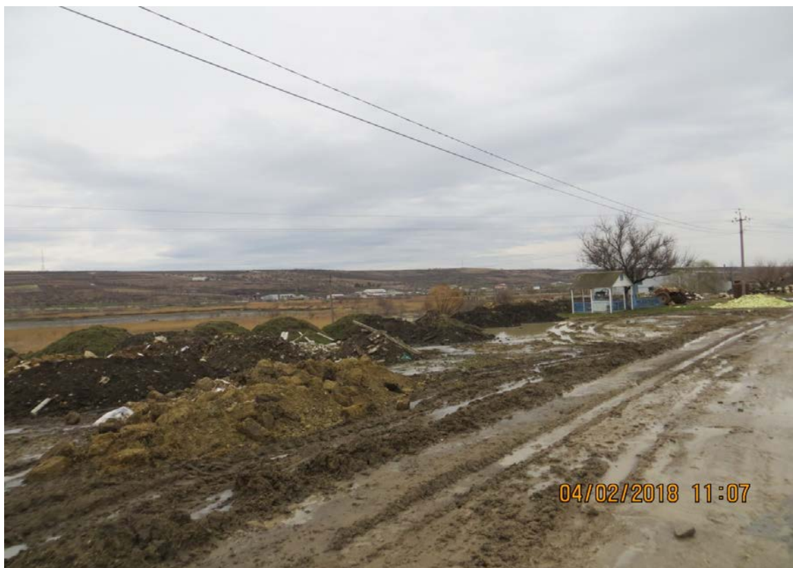
Intrarea în s. Costești