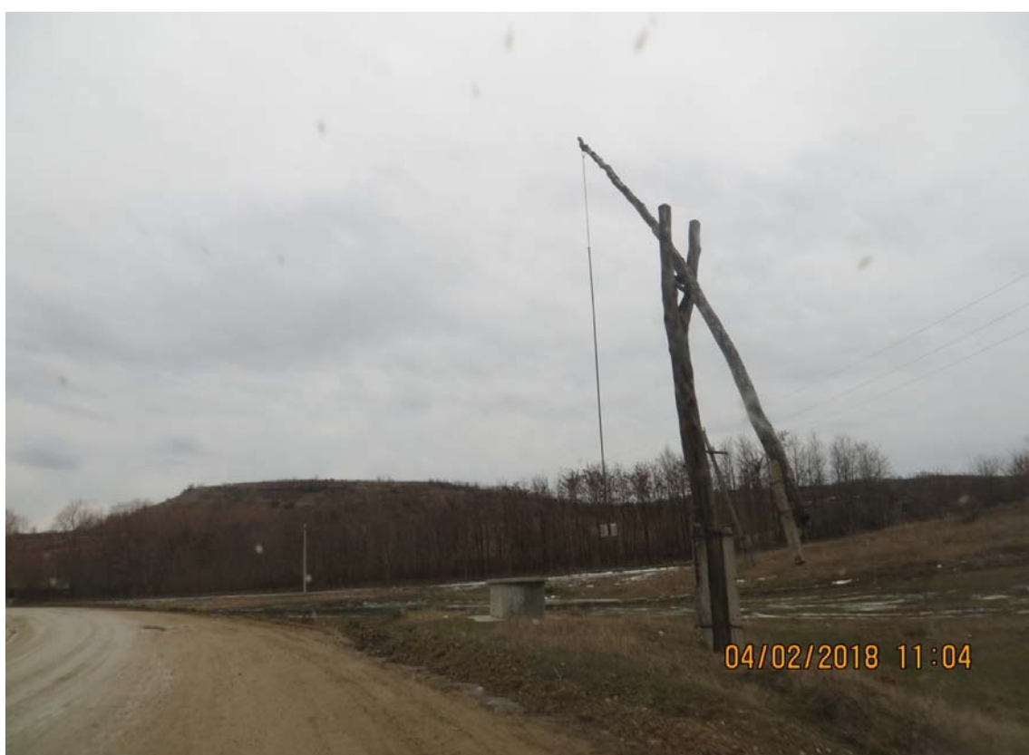
Între satele Pojăreni și Costești